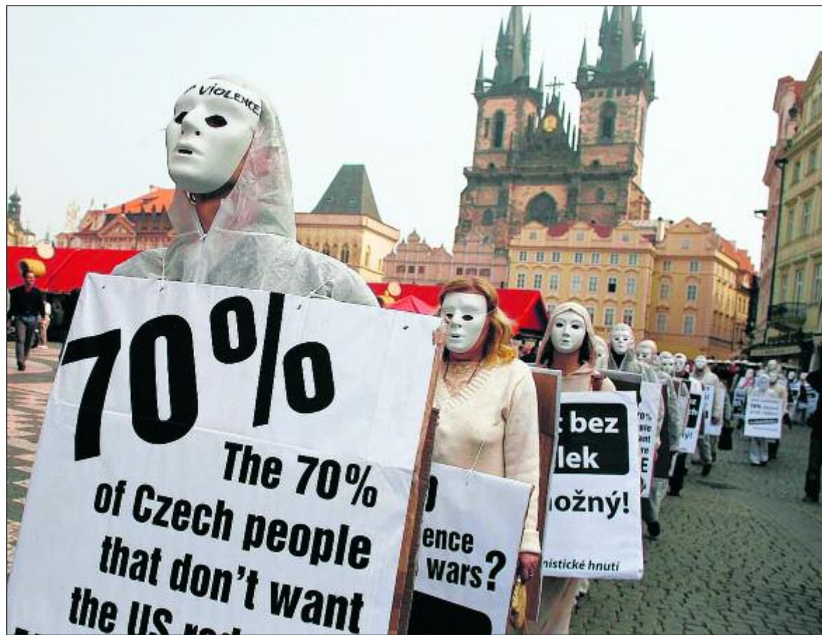
Nicht alle jubelten dem US-Präsidenten Obama in Prag zu. Friedensaktivisten protestierten gestern gegen den geplanten Raketenstart der USA in Osteuropa.